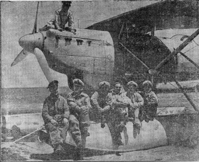
JUGOSLAV AIRMEN , relaxing against their seaplane, smile contentedly during a rest pause behind the Allied lines in North Africa. Last spring they fought against hopeless odds in the Battles of Jugoslavia, Greece and Crete and were finally forced to retreat to the Middle East. But now they are on the winning side of the argument, and in the last few weeks, together with Allied Polish, Czechoslovak, Free French, Anzac, British and Indian forces, they have not only recaptured most of Lybia from the Axis, but in addition have smashed and wiped out the bulk of the German and Italian armies in Africa.