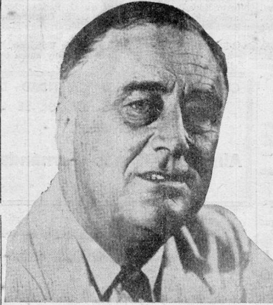
FRANKLIN DELANO ROOSEVELT

Desde el Templo de la Música pronunciaron elocuentes discursos, el jueves en la noche, el periodista don Otilio Ulate y el señor Presidente de la República, doctor Calderón Guardia